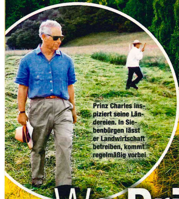
Prinz Charles inspiert seine Ländereien. In Siebenbürgen lässt er Landwirtschaft betreiben, kommt regelmäßig vorbei

Hätten Sie's gewusst? Britanniens Thronfolger hat rumänische Wurzeln. Und in Siebenbürgen spielt er Pensions-Wirt für Urlauber