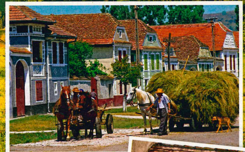
Gelassene Ruhe statt Hektik, Pferde-Fuhrwerke statt Traktoren, pittoreske Gassen mit schmucken Häusern in den Dörfern: In Siebenbürgen scheint es, als sei die Zeit stehengeblieben